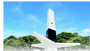
FAROL DO CABO BRANCO

João Pessoa, 19 de dezembro de 2022 * nº 180 * Pág. 001/013