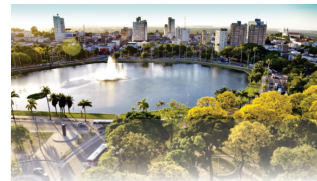
PARQUE SOLON DE LUCENA

João Pessoa, 01 de dezembro de 2025 * nº 0908 * Pág. 001/020